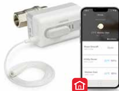
Braukmann L5 WiFi спирателен кран при теч на вода