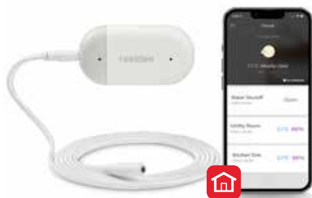
Braukmann L1 WiFi детектор на течове и замръзване на вода

Работейки заедно, тези продукти предоставят на клиентите допълнително спокойствие, като ги предупреждават за течове или замръзващи тръби. Освен това, възможността за спиране на водата от спирателния кран намалява потенциалните щети в домакинството. Всичко това може да бъде управлявано от смартфон през приложението Resideo, което го прави задължително решение за съвременните, технически грамотни собственици на жилища.